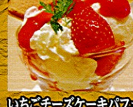
いちごチーズケーキパフェ ¥520