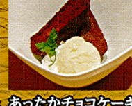
あったかチョコケーキ ¥390