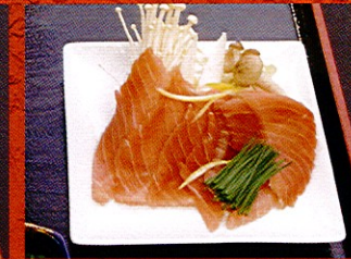
ハラミまぐろしゃぶ ¥890