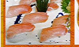
国産本まぐろ 中トロ寿司1人前 ¥2,480