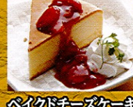
バイクドチーズケーキ ¥390