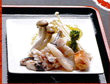
あんこう鍋味噌仕立て ¥790