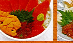
まぐろ・うに・いくら丼 ¥1,280